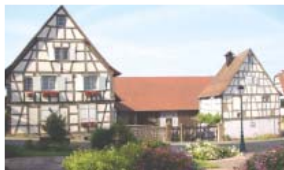
Maison Rurale de l'Outre-Forêt