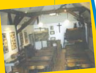
La salle de classe