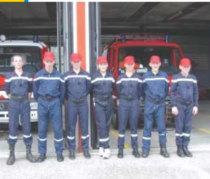
Jeunes Sapeurs Pompiers (JSP)

La communauté de communes de la vallée de la Sauer dispose à ce jour de deux unités territoriales.