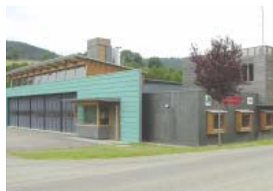
Centre de secours de Lembach