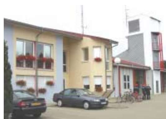
Centre de secours de Wœrth

Il ne faut pas oublier les JSP (Jeunes Sapeurs Pompiers) de Preuschdorf, Goersdorf et Wœrth qui sont un excellent vivier pour les prochaines années. Entourés et formés par des moniteurs assermentés, ils apprennent leur futur métier avec passion. Comme leurs aînés, ils s'impliquent souvent dans les manœuvres et s'attirent la sympathie de la population de la vallée de la Sauer.